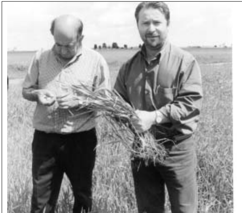
El presidente de ASAJA inspeccionó personalmente los cultivos afectados por nefasia.-

El Presidente del la JAL y el alcalde del Ayuntamiento presentarán en el Servicio Territorial de Agricultura y Ganadería los justificantes de todos los agricultores que han recibido producto, firmado por ellos, y devolverán el producto no utilizado al Establecimiento que determine el Servicio Territorial de Agricultura y Ganadería.