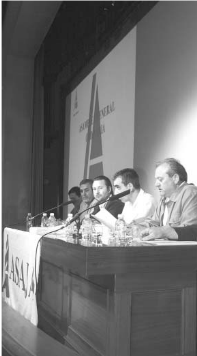
La Asamblea sirvió para informar de las cuentas de ASAJA.

PRECIOS AGRARIOS.- Dujó informó del año especialmente difícil en cuanto a los precios, sobre todo los de la leche y patatas, con reiteradas manifestaciones en defensa de ambos sectores. “Seguimos luchando en el sector lácteo por un precio digno y justo para nuestros ganaderos, que han hecho grandes inversiones en mejora de infraestructuras y explotaciones, y tienen que ser correspondidos. En patata es vergonzoso que un producto que tiene de costes entre 12 y 13 pesetas se hayan tenido que vender a 3 ó 4 pesetas, o incluso a nada, cuando además esas mismas patatas a la vuelta de 200 kilómetros en una gran superficie estaban a 60 ó 70 pesetas. Denunciamos los márgenes abusivos, el afán enriquecedor, lo que roban las grandes superficies a los agricultores y a los consumidores”, finalizó.