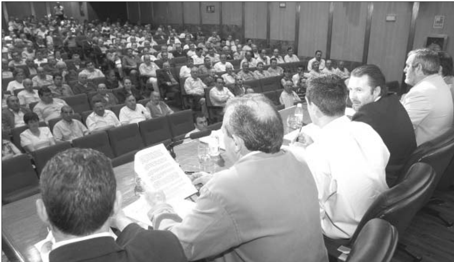
El presidente y la directiva de ASAJA-PALENCIA durante la asamblea general ordinaria celebrada en Caja España el día 23 de mayo.