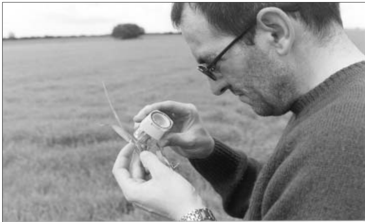
Un técnico de ASAJA-PALENCIA observa los daños producidos por la nefasia en la cebada del Cerrato.-

El gasto de adquisición del producto para los agricultores en la Junta Agropecuaria Local deberán abonarlo los propios Servicios Territoriales de Agricultura y Ganadería previa jus-