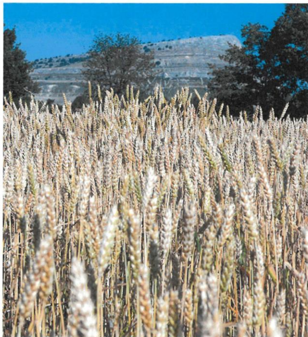
Campo de trigo en la provincia de Soria.