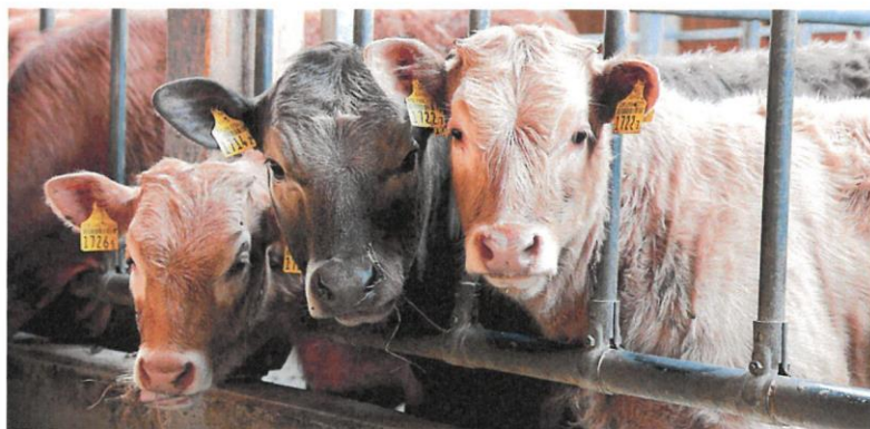
Tres terneras de carne asoman por las teleras de un cobadero en una explotación ganadera.