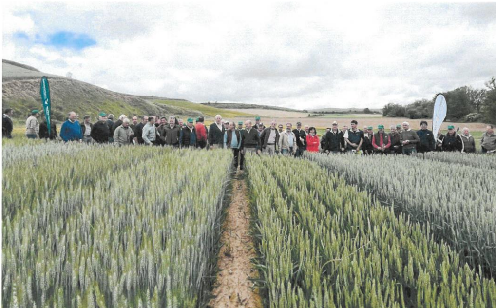
Visita de agricultores a los campos de ensayo de la Fundación Caja Rural de Burgos gestionados por el Itacyl.