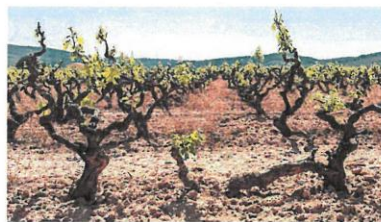
Un majuelo con viñedo añejo en una explotación vitícola.

Por su parte la Consejería de Agricultura, Ganadería y Desa-