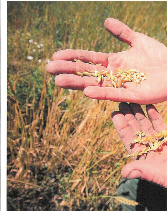
Un agricultor sostiene granos de cereal en una explotación agrícola.

> ÁVILA. Reduce su superficie total con solicitudes a la PAC un 0,26% respecto al año anterior hasta las 509.644 hectáreas, de las que barbecho y pastos son las dos terceras partes, 374.113, y tierras de cultivo las 135.531 restantes. Aumenta sin embargo esa superficie de cultivos