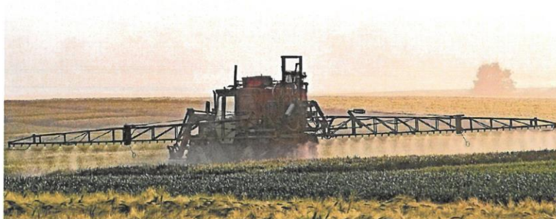
Un agricultor suministra productos fitosanitarios en su explotación de cereal.