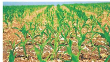
Brotos verdes en una plantación de maíz. pos / cco

Además, los agricultores de la Unión Europea podrán cumplir la normativa de rotación de cultivos optando por rotar o diversificar sus cultivos en función de las condiciones a las que se enfrenten y si