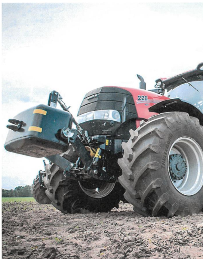
Un agricultor se dispone a preparar el terreno para la siembra con un moderno tractor.

7> RELEVO GENERACIONAL. Medidas de apoyo reales al relevo generacional. Es necesario respaldar la incorporación de jóvenes hombres y mujeres a la actividad agraria y ganadera con medidas políticas, dándole prioridad en la concesión de ayudas, y económicas con bonificaciones. Además, este reto exige no solo asegurar la incorporación de los jóvenes al campo, sino también su permanencia, a través de la profesionalización y conseguir la rentabilidad de sus explotaciones. Para ello se debe fomentar su incorporación