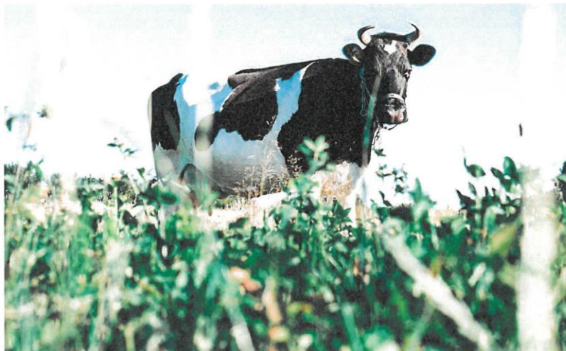
Una vaca lechera pasta en un prado.

▷ PAC. Opas y Cooperativas demandan en su escrito una simplificación real de la PAC y la eliminación de burocracia para agricultores y ganaderos. Desde el punto de vista del agricultor y ganadero, la nueva PAC