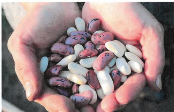
Un productor muestra un puñado de alubias

Y es que, dentro del escenario actual, en el que el consumidor está cada vez más sensibilizado con la sostenibilidad de la agricultura y la despoblación de las zonas rurales, así como con la alimentación saludable, los alimentos tradicionales producidos en sistemas agrarios tradicionales juegan un papel muy importante en el desarrollo económico y la fijación de población en estas zonas. Por tanto, deben ser tenidas en cuenta. Además, son unos de los productos alimenticios que tienen espacio para crecer, tanto en el plato como en el campo.