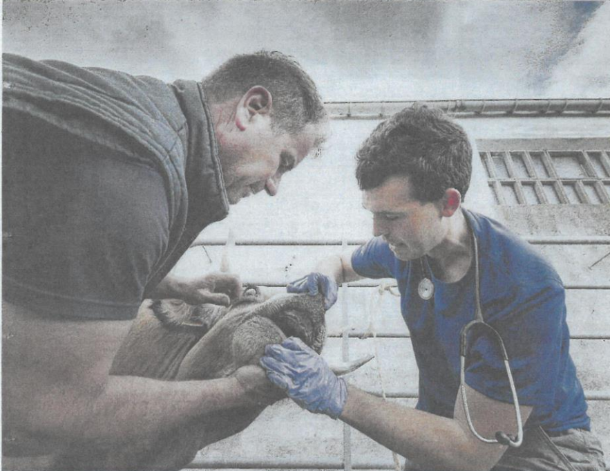
La labor de los veterinarios es esencial para el mantenimiento de la salud animal, pero también humana.