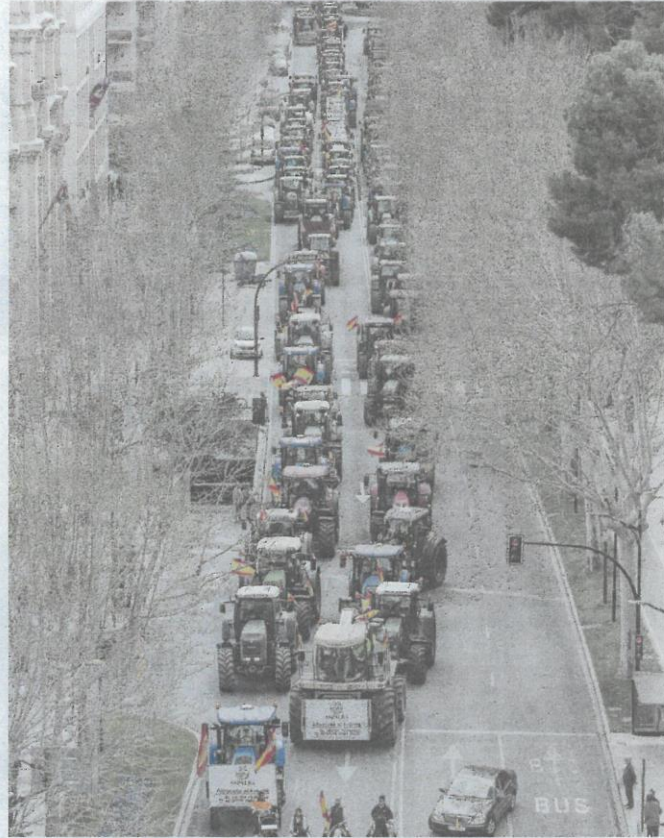
Las organizaciones agrarias quieren que sus reivindicaciones figuren en los programas electorales.

«Somos un sector estratégico, en la construcción de la Unión Europea se consideró así. Las circunstancias demuestran que debemos recuperar esos principios», afirman. «Los acontecimientos de escala mundial que afectan a nuestras vidas, como las guerras, la pandemia o el cambio climático, demuestran que es fundamental garantizar la alimentación de todos, al tiempo que se protege el medio ambiente y se mantienen vi-