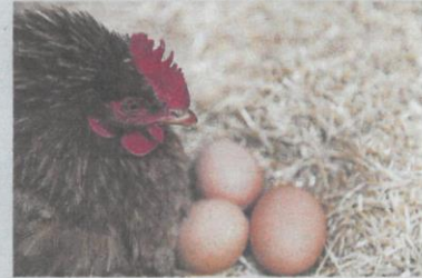
Imagen de una gallina ponedora.

Además, la normativa europea posibilita también el uso de proteínas animales transformadas derivadas de insectos de granja en los piensos para ambas especies ganaderas.