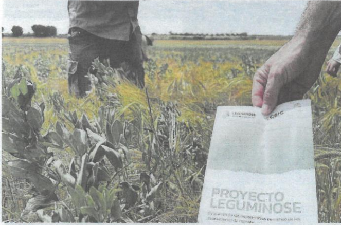
Imagen del intercultivo de cebada y leguminosas en pleno desarrollo.