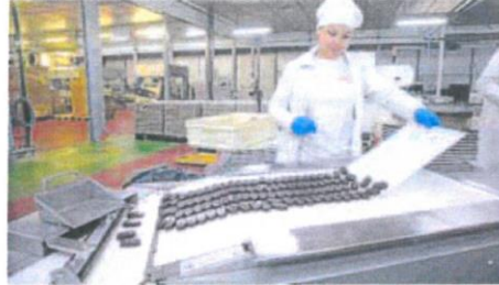
Una trabajadora de la fábrica de Chocolates Trapa en Dueñas. A. HINQUEZA

Tradicionalmente, el sector agroalimentario y el de la automoción pugnan por el liderazgo en Castilla y León, ambos con un peso superior al 20% dentro del sector industrial. Con una producción de 9.639,3 millones en 2021, la industria de la alimentación supuso el 28,2% del total de manufacturas, con lo que conquista el primer puesto con gran ventaja dentro de la comunidad. Ahora bien, si la comparación se hace con el peso de las fábricas de la