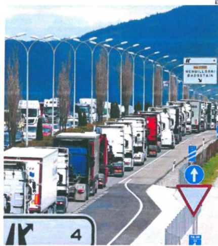
Caravanas de camiones durante los paros del pasado mes de marzo

Desde Plataforma aseguran que su amenaza de nuevos paros si esta norma no estaba en vigor en julio fue respondida por el Ejecutivo casi in extremis y que horas antes del día de la votación «recibimos una llamada del portavoz de Transportes en el Congreso del PSOE» para mantener una reunión. En el encuentro, se les entregó el borrador de la Ley para prohibir la contratación a