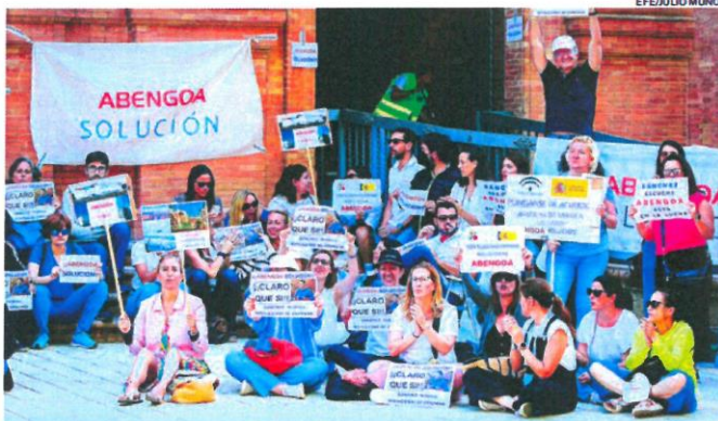
Trabajadores de Abengoa ante la sede de la Delegación del Gobierno de Andalucía