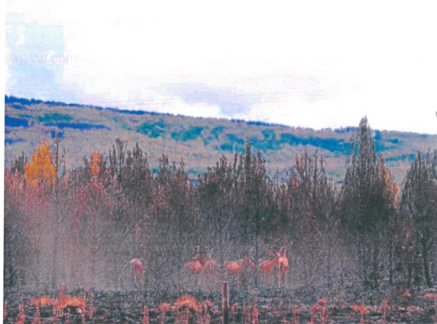
Varios ejemplares de ciervo entre las cenizas del incendio de la Sierra de la Culebra