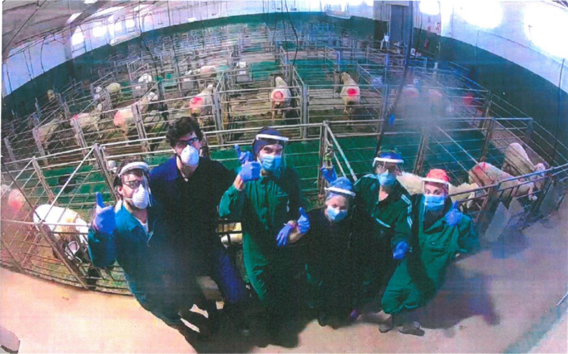
Investigadores participantes en el proyecto europeo SMARTER. EL MUNDO