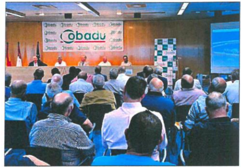
Asamblea General de Cobadú en el recinto de Ifeza, ayer.