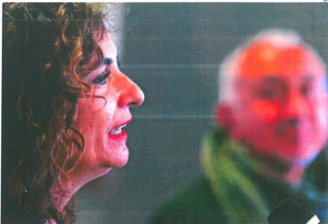
María Jesús Montero, ministra de Hacienda, ayer, durante su reunión con los sindicatos