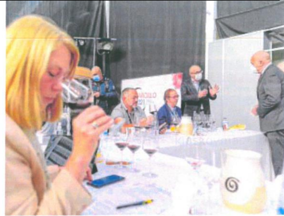
El consejero de Agricultura se acerca a una de los jurados