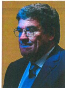
José Luis Escrivá

Este complemento promete llegar a un número de beneficiarios mucho mayor que el IMV actual al incluir a los hogares en situación de pobreza relativa y no solo a los de pobreza severa», aseguró el ministro de Seguridad Social, José Luis Escrivá. No obstante, las lagunas en la configuración del IMV podrían extenderse a esta ayuda. Un año y medio después de su aprobación, el IMV solo da cobertura al 41% de los 850.000 hogares que prometió proteger.