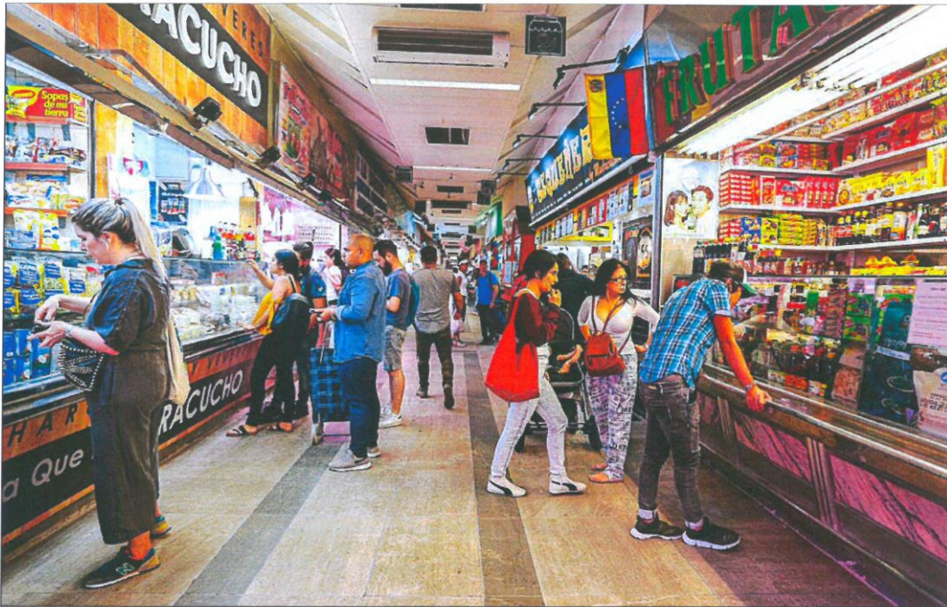
Consumidores compran en el Mercado Maravillas, en el madrileño barrio de Cuatro Caminos. SERGIO ENRÍQUEZ-NISTAL

MUNDO (Danone, Nestlé, Pepsico o Ebro Foods, entre otros) se mantienen al margen de un debate que es considerado casi tabú, pues «el consumidor es muy sensible al precio y más en estos momentos», explican fuentes del sector. Sin embargo, «tarde o temprano habrá que repercutir estos costes», admiten en una gran empresa de alimentación.