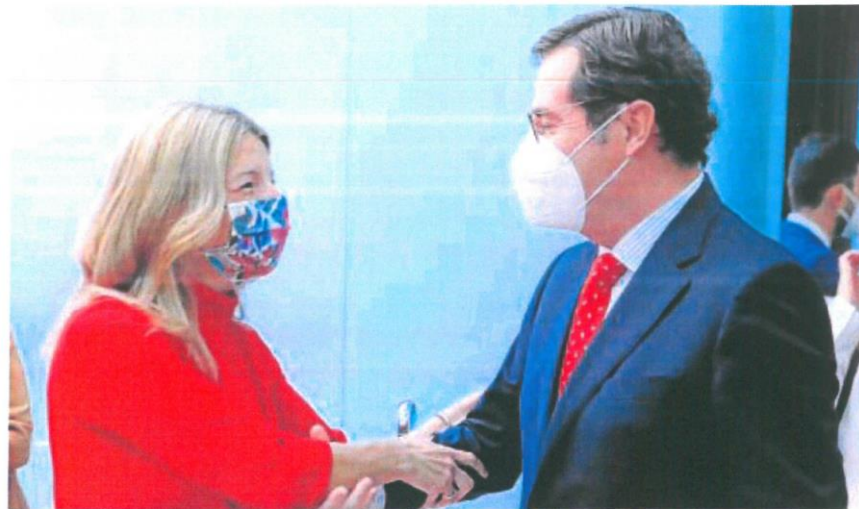
Yolanda Díaz, vicepresidenta y ministra de Trabajo, saluda a Antonio Garamendi, presidente de la CEOE

Solo tres de cada diez empresas afirman que van a pedir estos fondos, y esto se da en sectores como la hostelería (43,4%) y en las compañías de mayor tamaño (41,2%). Además, la creencia mayoritaria es que los fondos europeos beneficiarán solo a las grandes empresas. Así piensan el 61,8% de las compañías encuestadas. También hay un amplio consenso sobre la conveniencia de que los fondos incluyan una agenda de reformas. A este respecto, Bonet instó a «redoblar el esfuerzo de información y sensibilización» sobre los fondos.