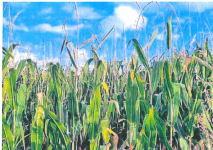
Cultivo de maíz esta campaña en la provincia de Valladolid. RAQUEL VEGA

Ese plan estratégico debe presentarse a Europa para su revisión antes de fin de año para que pueda entrar en vigor el 1 de enero de 2023, pero «no sé si va a ser