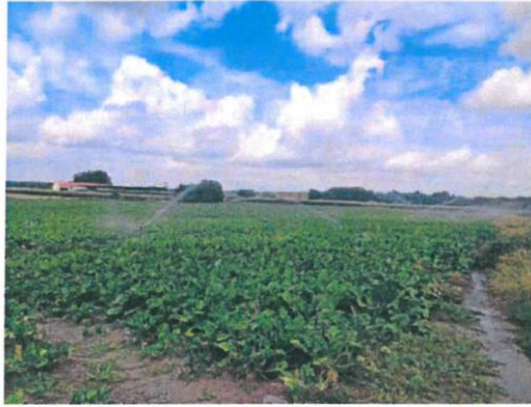
Riego en una tierra de remolacha en la localidad vallisoletana de Pollos, s.a.s.

A pesar de que el riego avance en las mejores condiciones, desde la Confederación Hidrográ-