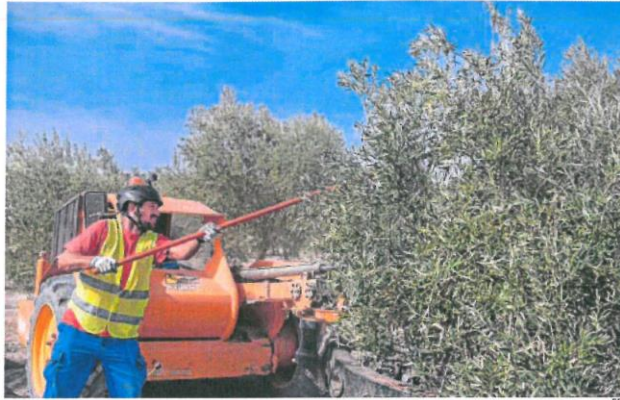
Productos como el aceite y la aceituna de mesa tienen en Estados Unidos uno de sus principales destinos