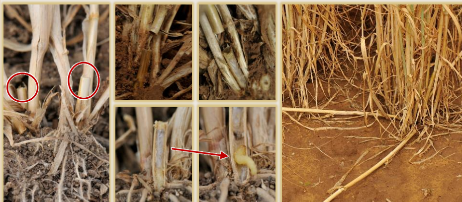
Tronchaduras en la base de la planta, sección de la cámara de pupación y tallos caídos