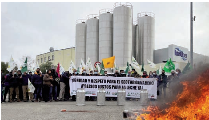
Hogueras y petardos acompañaron la manifestación realizada a las puertas de Lactiber, industria láctea instalada en León

atesora aproximadamente 25.000 vacas lecheras. La no puede dejar las cosas más claras: la industria láctea debe pagar por la leche al menos lo