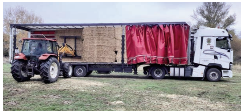
Paja enviada por ASAJA-Palencia siendo descargada en La Hija de Dios (Ávila)

más ordenada posible a los ganaderos afectados de Ávila. También, a través de una cuenta bancaria solidaria, se ha recaudado una importante cantidad de dinero, que en breve será entregada a la Diputación de Ávila, y será empleada en ayudar a las explotaciones ganaderas que perdieron sus pastos por el incendio. Desde ASAJA-Ávila, agradecen a todos los agricultores y ganaderos de nuestra organización, que han colaborado con su generosidad, tanto en aportaciones de productos como económicamente para que los ganaderos afectados por el incendio de Navalacruz puedan seguir adelante con su actividad y sobreponerse a este desastre tan importante.