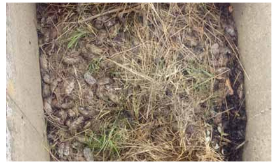
Los topillos muertos invaden las acequias y sifones de riego, provocando contaminación de las aguas.-

Y es que los topillos muertos atascan los aspersores, las acequias, los sifones de riego, por lo que están permanentemente expuestos a enfermar por el contacto directo con el principal foco de propagación de la tularemia. A todo ello se añade el nauseabundo olor que provocan los animales.