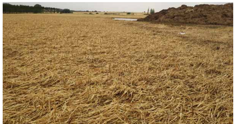
En las fotos se aprecian los daños de las tormentas en una explotación de maíz de Grijota. A la izquierda, la imagen captada antes y a la derecha, después de la tormenta. Debajo, daños en cereal.