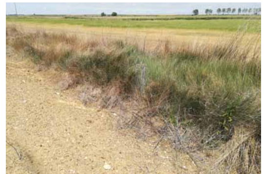
En esta imagen se aprecia el estado de abandono de los márgenes de carreteras, donde la maleza favorece los reservorios de topillos que luego avanzan para arrasar con las parcelas agrícolas.-